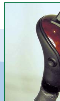
Holzhandgriff mit natürlicher Holzoptik.