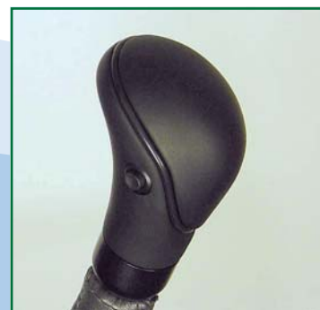
Schwarzer Handgriff mit grauer Abdeckung.