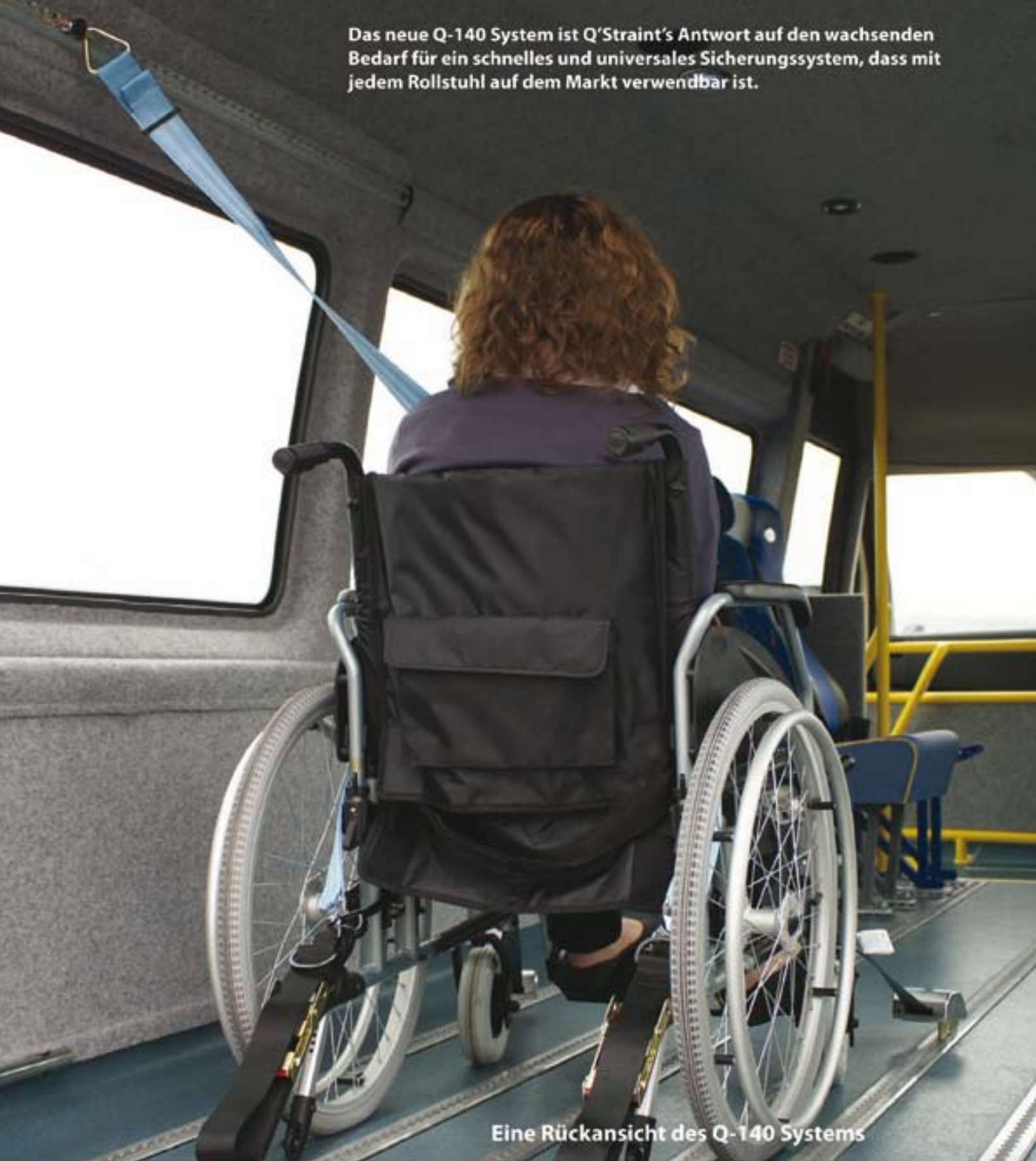
Eine Rückansicht des Q-140 Systems

Das neue Q-140 System ist Q'Straint's Antwort auf den wachsenden Bedarf für ein schnelles und universales Sicherungssystem, dass mit jedem Rollstuhl auf dem Markt verwendbar ist.