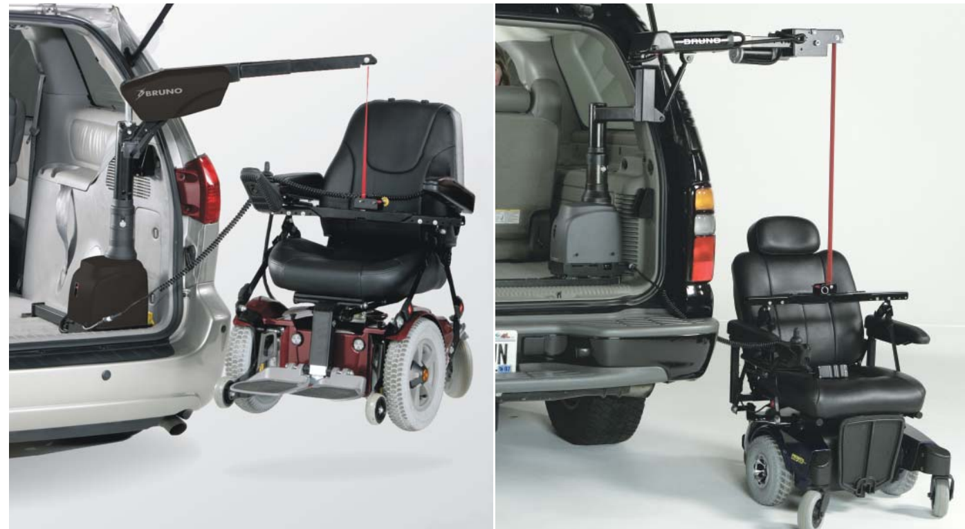
Carolift 6000 hat eine Hebekapazität von 181 kg. Carolift 6900 (Teleskop-Krankopf) hat eine Hebekapazität von 181 kg.

Carolift 6900 besitzt einen teleskopischen Krankopf, der den Einsatz in Fahrzeugen mit schmaler Hecköffnung oder vorstehenden Stoßfängern ermöglicht.