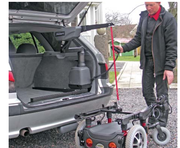
Der Carolift 6000 lädt das Fahrgestell des Elektrorollstuhls Carony Go in einen Peugeot 406 mit schräger Heckklappe.