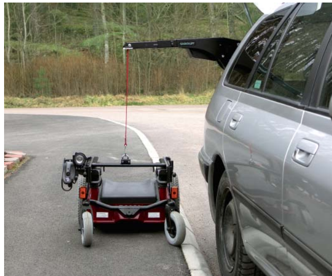
Carolift 6000 lädt ein Carony-Go-Fahrgestell vom Bürgersteig ein.

Carolift 6000/6900 besitzt einen gewinkelten Kranarm (zwei „Ellenbogen“), mit dem sich ein Rollstuhl von der Fahrzeugseite aus ein- und ausladen lässt. Sie können also den Rollstuhl auf dem Bürgersteig stehen lassen und müssen ihn nicht auf die Straße hinunterfahren.