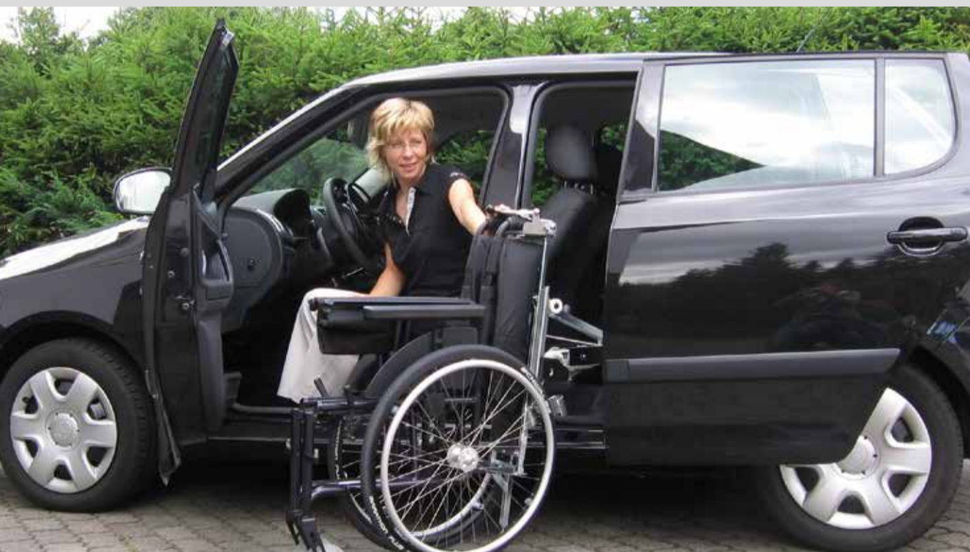
01 Die automatische Ladehilfe mit Schwenktüre. Schnell, sicher und unauffällig verstaut die Ladehilfe Ihren Rolli im Fahrzeug.

Die manuelle Schwenktüre; Der Ladeboy für Kofferraum; Das Seilzug Verladesystem; Der Robot (Kofferraum);