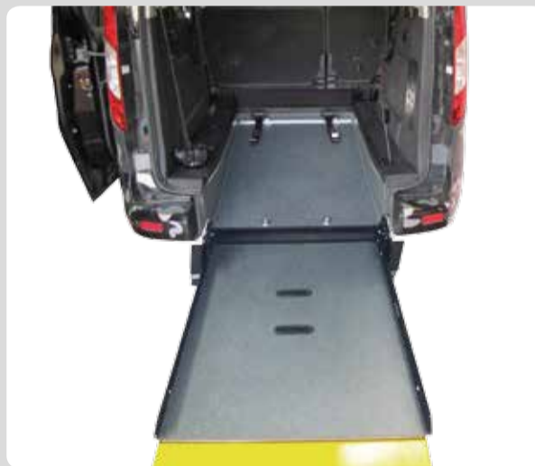
Tourneo Connect NIVO. 5 Sitzplätze + Rollstuhlplatz gleichzeitig nutzbar im Grand Connect. 2-3 Sitzplätze + Rollstuhlplatz gleichzeitig nutzbar im Connect. FLEX-Rampe verfügbar bei Connect.