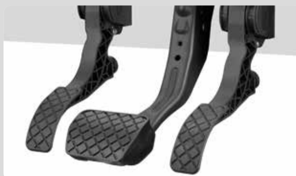
04 Das Gaspedal links elektronisch. Sicher, komfortabel, modern.