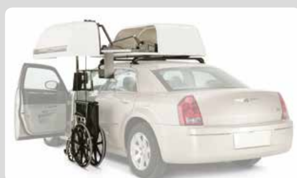
02 Die Rollstuhlbox für's Autodach. 4 Mitfahrer + Gepäck + ihr Rolli? Kein Problem, die Rollstuhlbox macht es möglich.