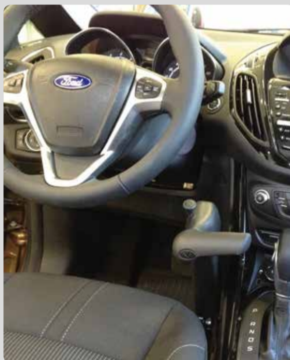
02 Die Veigel Classic Handbedienung. Geringer Kraftaufwand durch Gas-Drehfunktion.