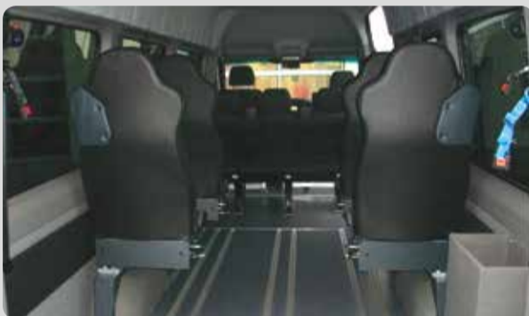
01 Einzel-/Doppelsitze für Alusystemboden. Flexibilität in der Bestuhlung ihres Fahrzeuges mit Einzel-/ Doppelsitzen und wahlweisen Rollstuhlplätzen.

Rollstuhllifte einarmig, Selbstfahrer Hebebühne SF-Lift; Aluminium Rampen schwenkbar; Aluminiumrampen 3-teilig; Aufharrschienen auf Welle fix montiert; Aufharrschienen faltbar/zusammenschiebbar;