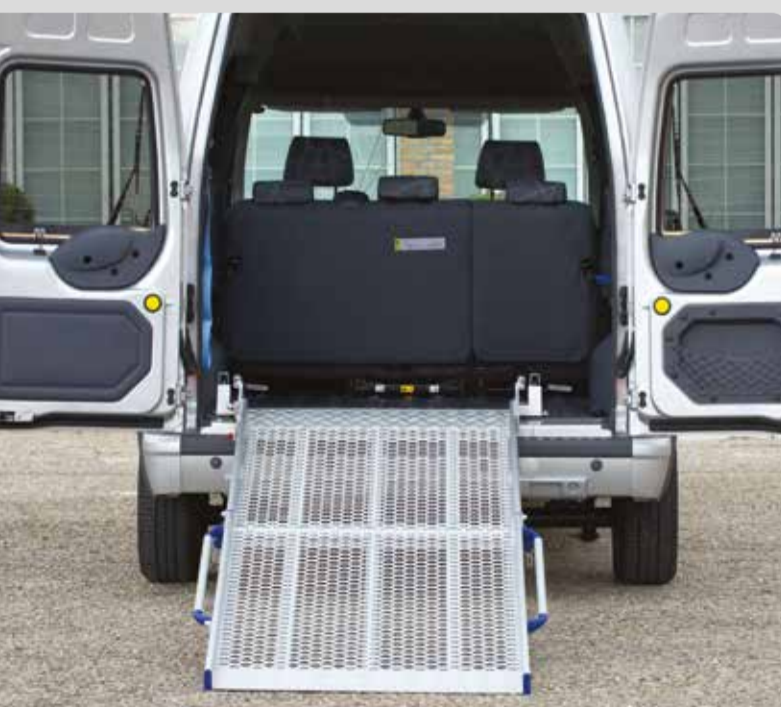
03 Rollstuhlaufharrampe. Robust und langlebig. Einfach in der Bedienung.