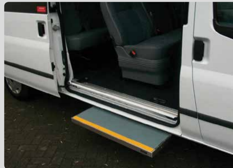
06 Trittstufen. Gewährleisten die Sicherheit ihrer Passagiere. Einfache und komfortable Bedienung.