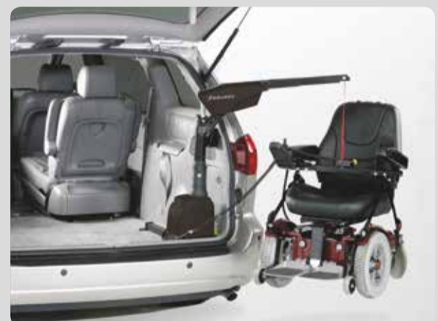
04 Der Rollstuhl-Ladelift. Leichter Faltrulli (25 kg), Faltrulli mit E-Fix, schwerer E-Rolli oder Scooter (bis 160 kg), sollen in den Kofferraum? Mit unseren Rollstuhl-Ladeliften geht das sicher und komfortabel.