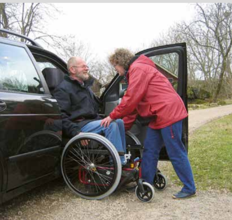
01 Der Carony. Umsetzen nein Danke! Drehen – rausschieben – wegfahren. Rollstuhl und Autositz in einem. Einfach Carony.

Milford Lift; Top Slider; Selbstfahrerhebebühne SF-Lift; Aufrichtehilfe; 6 Wege-Sitz;