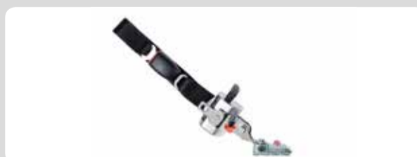
05 Rollstuhlhaltesysteme. Abnehmbare Spanner, 3 Punkt-Gurte, Bodenschienen oder einzelne Befestigungspunkte. Wie Sie wollen.