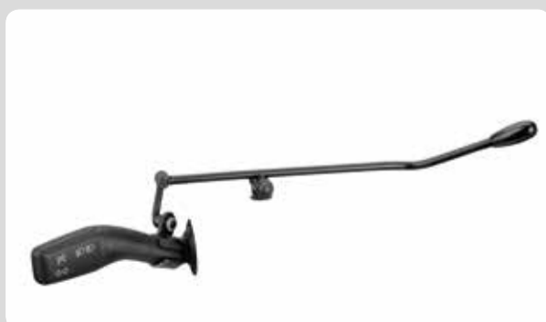
02 Die Wischer oder Blinkerhebelverlegung über Zusatzhebel. Aktivierung der Wischer- und Waschfunktionen bzw. von Blinker und Fernlicht.