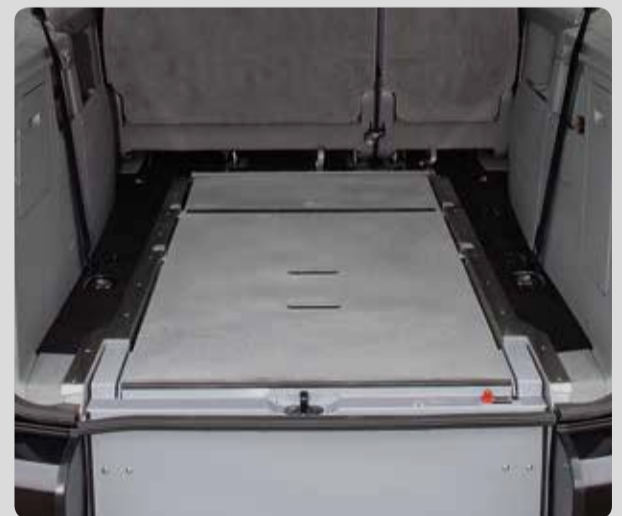
Die FLEX-Rampe. ermöglicht Ihnen die Nutzung des Kofferraumes ohne Einschränkungen. Durch den speziellen Klappmechanismus wird die Unterseite der Rampe zur Oberseite des Kofferraumbodens. Verfügbar für Tourneo Connect ab August 2014.