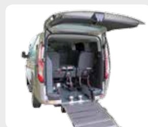
Absenkfahrzeuge S. 07