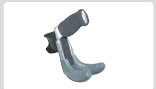
04 Die Lenkhilfe Dreizack. Individuell einstellen auf die Bedürfnisse des Fahrers.