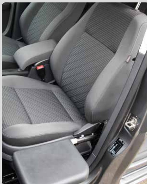
02 Die Umsetzhilfe. Für Fahrer oder Beifahrer, klappbar und abnehmbar.