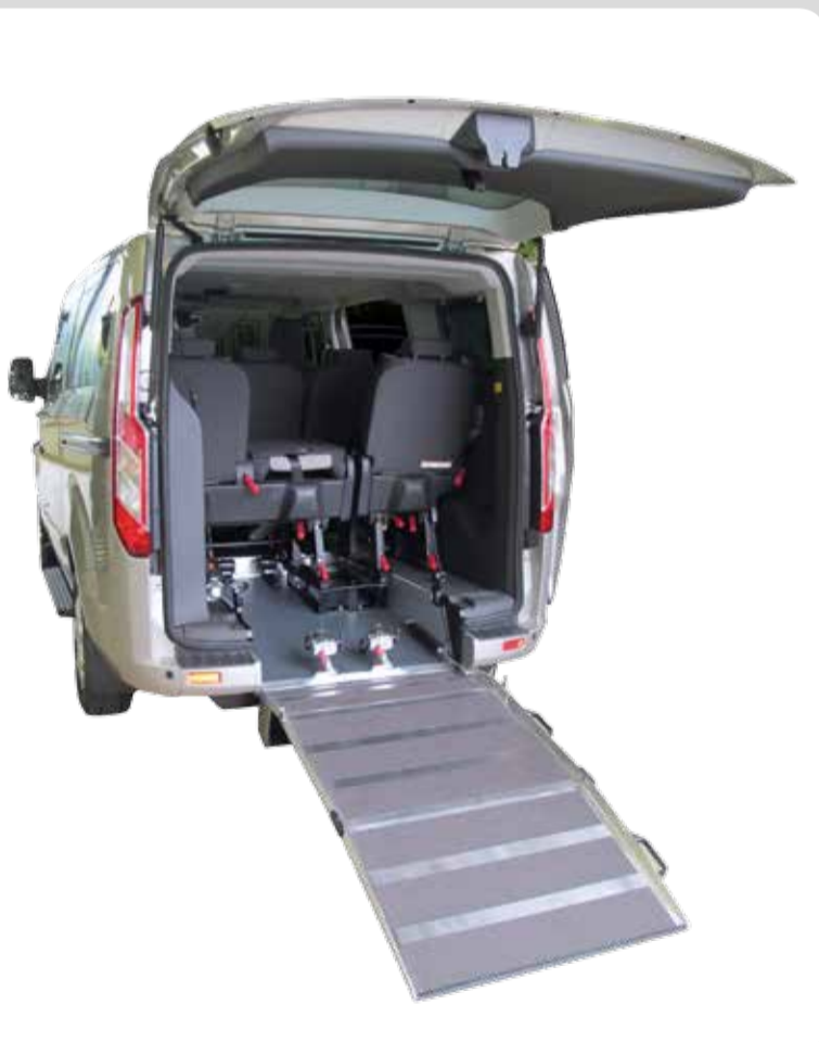
Tourneo Custom (L1 & L2) NIVO. Bis zu 6 Sitzplätze + Rollstuhlplatz gleichzeitig nutzbar (L1 & L2). Bis zu 9 Sitzplätze ohne Rollstuhlplatz nutzbar (L2).