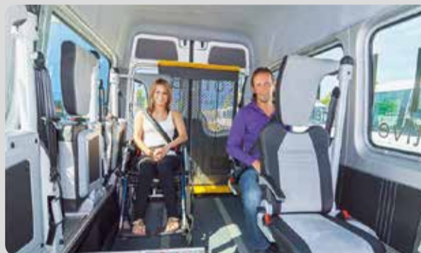
02 System Rolli Box. Planung wieviele Sitze/ Rollstuhlplätze Sie heute brauchen? Sie sind auf alles vorbereitet, egal was kommt!