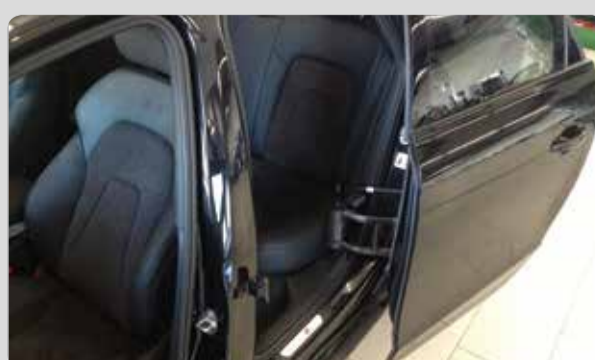
03 Die automatische Schwenktüre. Ihr Rolli soll auf die Rücksitzbank? Mit der automatischen Schwenktüre haben Sie alles selbst im „Griff“.