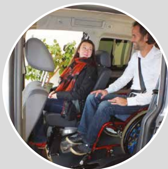
Wählen Sie ihre Lieblings-Position auf dem einzigartigen FLEX-Floor des Tourneo Connect NIVO FLEX .