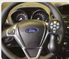
Bedienhilfen S. 03