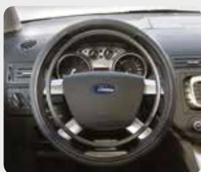
Fahrhilfen S. 04