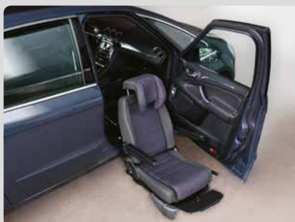
03 Der Turny. Der absenkbarer Drehsitz für alle Vans oder SUVs.