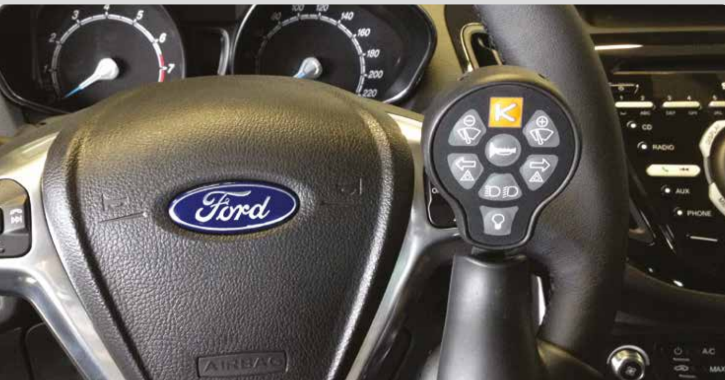
01 Der Telekommander. Bis zu 12 Fahrzeugfunktionen (Wischer, Blinker, Hupe, Fernlicht usw.) am Lenkradknopf sicher im Griff.

Lenkhilfe Gabel; Lenkhilfe-Sonderanfertigungen;