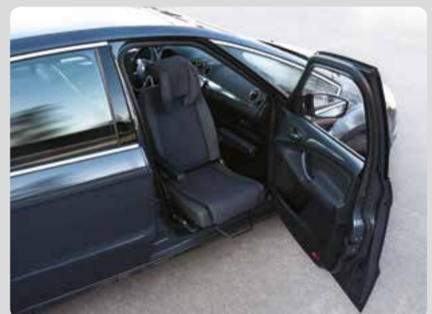
04 Der Turnout. Der Drehsitz für alle Pkw.