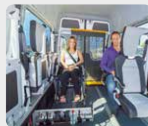
Kleinbusse S. 08