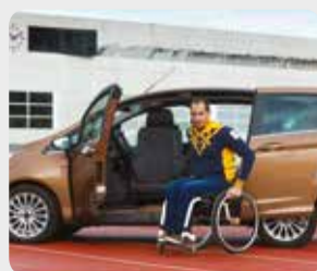
Einstiegshilfen S. 05