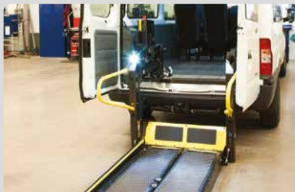
04 Rollstuhllifte doppelarmig. Sicherheit und Komfort stehen an erster Stelle.