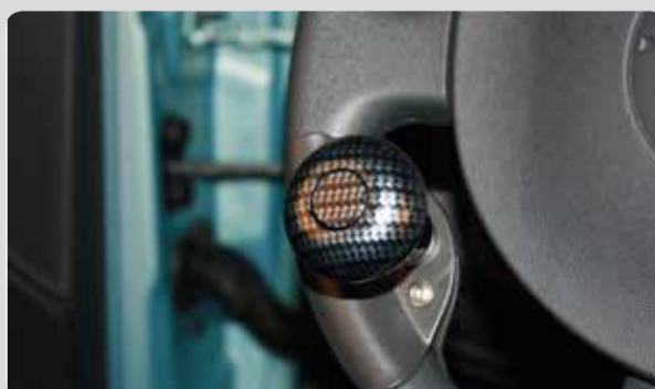
03 Die Lenkhilfe Drehknopf. Ergonomisch, abnehmbar und in verschiedenen Designs erhältlich.