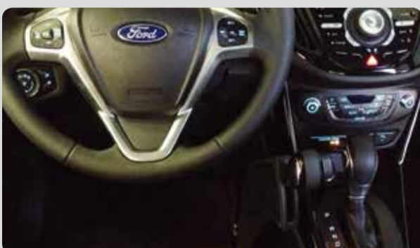
03 Die Handbedienung Comfort EVO. Einzigartige Kombination aus Design und Funktion.