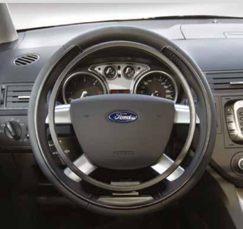
01 Der elektronische Gasring. Das sportliche Fahrgefühl mit beiden Händen am Lenkrad.

Veigel Compact Handbedienung; Veigel Classic/Compact Handbedienung mit Basic oder Veigel-Commander; Carospeed Indicator, Carospeed E; Gas- und Bremshebel links oder rechts hängend; Gas- und Bremshebel Europa mechanisch oder elektronisch links oder rechts hängend; Gaspedal links mechanisch stehend; Gaspedal links mechanisch klappbar; Gaspedal links mechanisch abziehbar; Pedalausätze/Vorsatzpedale; Automatische Kupplung;