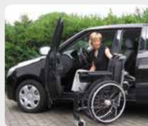
Verladehilfen S. 06